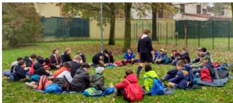
Il Branco dei Lupetti durante la "Caccia" a Pieve di Cento il 21 ottobre 2016