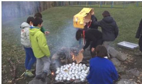
Attività al Campo invernale; gli scout del secondo anno cucinano le prelibate mele cotte alla brace, avvolte in carta stagnola.