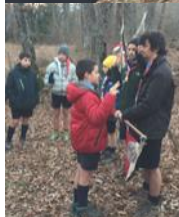
Due momenti della celebrazione della "Promessa", svoltasi all'alba del 29 dicembre, al campetto invernale di Giarola di Ligonchio.