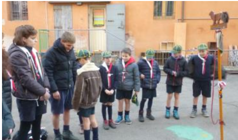
Un momento della cerimonia della "Promessa" dei Lupetti nel cortile della sede in san Giuseppe