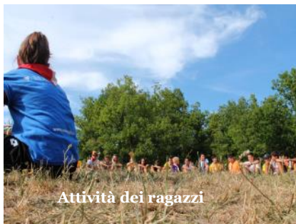
Attività dei ragazzi

Immagini dal Campo estivo dei Reparti scout del Bo 16 a Salto di Montese (MO) dal 24 luglio al 6 agosto