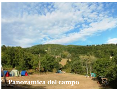
Panoramica del campo