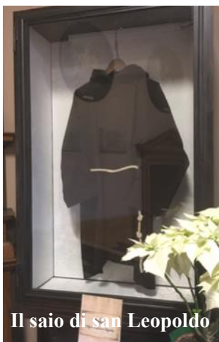
Il saio di san Leopoldo

A ricordo e memoria di questo eccezionale evento, organizzato dalla fraternità dei frati cappuccini di san Giuseppe, è stato allestito un apposito luogo di preghiera (cappella) situata a destra del presbiterio (il lato dove abitualmente si