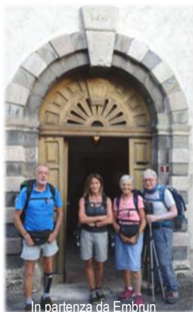
In partenza da Embrun

Quest'anno, dopo il percorso italiano dell'anno scorso, il pellegrinaggio parrocchiale ha attraversato, sui passi di Domenico, buona parte della Francia, da Embrun fino a Tolosa. Nella prima parte di questo cammino, fino ad Avignone, è sembrato veramente di cammina-