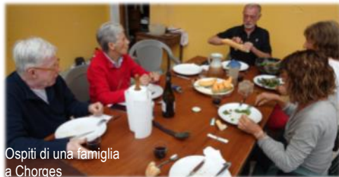
Ospiti di una famiglia a Chorges

re con Domenico Laffi: lunghissimi tratti senza incontrare nessuno, splendidi panorami di montagna, piccolissimi alberghi dove i pellegrini sono benvenuti, silenziose (e chiuse...) chiesette di campagna e belle chiese gotiche (senza la Messa del pellegrino, una bel-