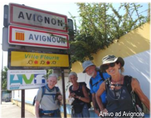
Arrivo ad Avignone

re con Domenico Laffi: lunghissimi tratti senza incontrare nessuno, splendidi panorami di montagna, piccolissimi alberghi dove i pellegrini sono benvenuti, silenziose (e chiuse...) chiesette di campagna e belle chiese gotiche (senza la Messa del pellegrino, una bel-