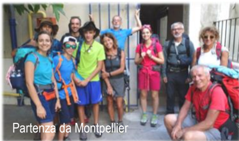
Partenza da Montpellier