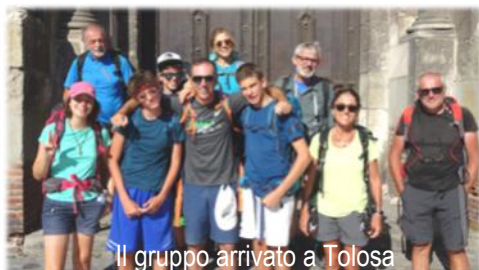
Il gruppo arrivato a Tolosa

La preghiera di ringraziamento finale ci proietta già verso la tappa del prossimo anno quando tutti i camminatori indosseranno una maglietta con la frase che padre Romano, in dialetto reggiano, ripeteva cento volte al giorno: "me ann nin poss più" ... non ce la faccio più!