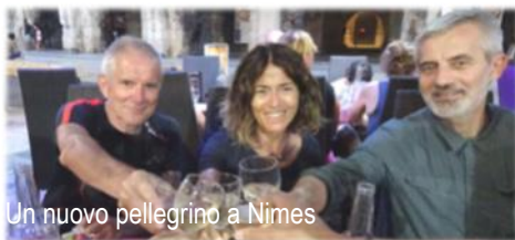
Un nuovo pellegrino a Nimes

Rimangono soprattutto i dialoghi e l'empatia con gli altri pellegrini e l'in-