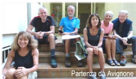
Partenza da Avignone

se a facilitare il loro ingresso in città! Ma, come lui, hanno potuto ammirare i monumenti del passato (il palazzo dei Papi, il Duomo, il Ponte) e, anche con l'aiuto del suo diario, rileggerne la storia civile e religiosa.