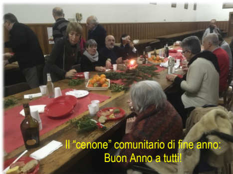
Il "cenone" comunitario di fine anno: Buon Anno a tutti!