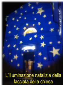
L'illuminazione natalizia della facciata della chiesa