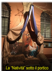
La "Natività" sotto il portico