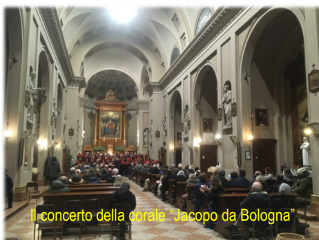
Il concerto della corale "Jacopo da Bologna"