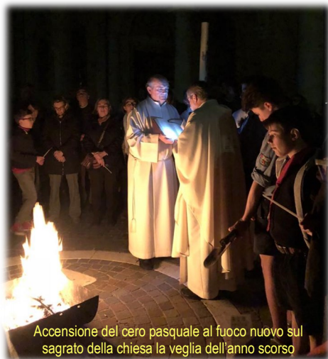
Accensione del cero pasquale al fuoco nuovo sul sagrato della chiesa la veglia dell'anno scorso

per dare spazio al fuoco nuovo del Cristo risorto...!