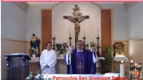
Parrocchia San Giuseppe Spesa

A mezzogiorno e alle ore 19.00 tutte le campane suoneranno a festa.