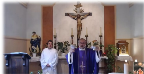
Un fermo immagine della Messa domenicale on line trasmessa dalla cappella interna conventuale

Ricordiamo anche che in questi giorni la nostra chiesa rimane aperta per la preghiera personale per le persone che vi possono accedere.