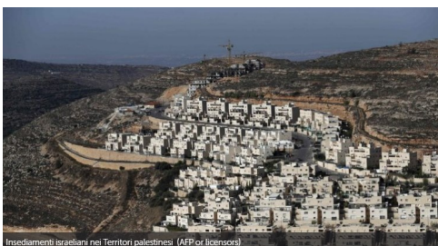
Insedimenti israeliani nei Territori palestinesi

“Insieme” sospende la pubblicazione per due settimane; uscirà di nuovo domenica 23 agosto . Nonostante i tempi difficili, auguriamo a tutti (anche se non tutti potranno viverlo) un tempo estivo di riposo, di serenità e di ricarica fisica e spirituale! Buona estate a tutti!