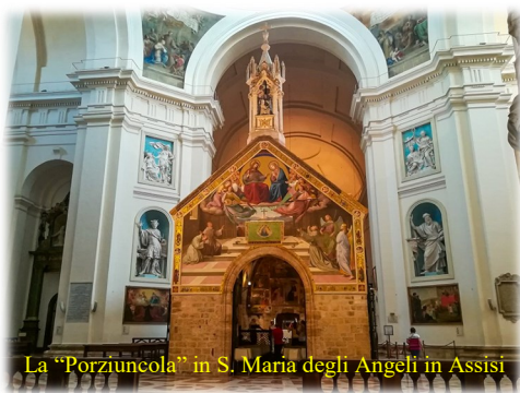
La "Porziuncola" in S. Maria degli Angeli in Assisi

Nel Catechismo della Chiesa cattolica (nn. 1478-9) si legge: «L' indulgenza si ottiene mediante la Chiesa che, in virtù del potere di legare e di sciogliere accordatole da Gesù Cristo, interviene a favore di un cristiano e gli dischiude il tesoro dei meriti di Cristo e dei santi perché ottenga dal Padre delle misericordie la remissione delle pene temporali dovute per i suoi peccati. Così la Chiesa non vuole soltanto venire in aiuto a questo cristiano, ma anche spingerlo a compiere opere di pietà, di penitenza e di carità [Cfr. Paolo VI, Cost. ap. Indulgentiarum doctrina , 8; Concilio di Trento: DS 1835 ]. Poiché i fedeli defunti in via di purificazione sono anch' essi membri della medesima comunione dei santi, noi possiamo aiutarli, tra l' altro, ottenendo per loro delle indulgenze, in modo tale che siano sgravati dalle pene temporali dovute per i loro peccati. Mediante le indulgenze i fedeli possono ottenere per se stessi, e anche per le anime del Purgatorio, la remissione delle pene temporali, conseguenze dei peccati. (CCC 1498)»