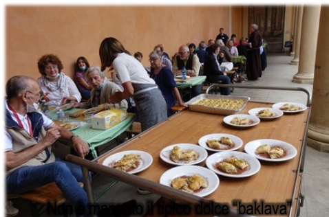
Allo spuntino il dolce "baklava"