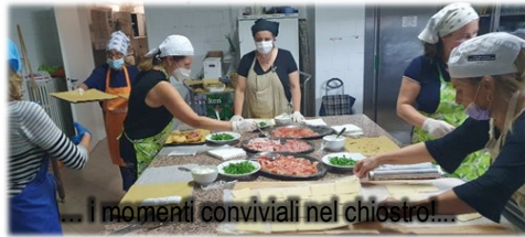
... i momenti conviviali nel chiostro!...