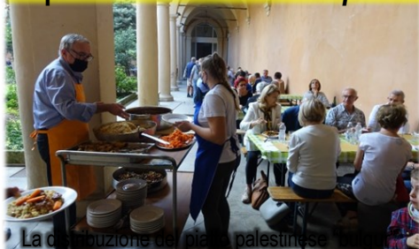
La distribuzione del pranzo palestinese preparato dai volontari e dai praticabili collaboratori che rip...

Il pranzo comunitario "A pranzo con San Giuseppe..!" (03/10/21)