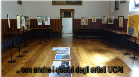
... con anche i quadri degli artisti UCAI