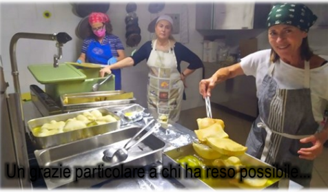
Un grazie particolare a chi ha reso possibile...