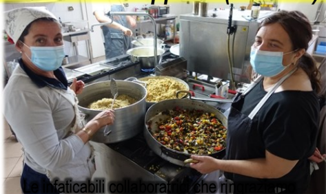
Le praticabili collaboratrici che rip...