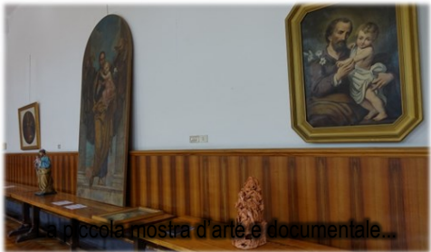
... una piccola mostra d'arte e documentale...