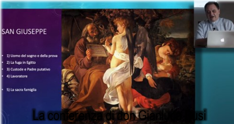
La committenza di don Giovanni Rossi