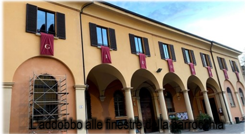
L'addobbo alle finestre della parrocchia