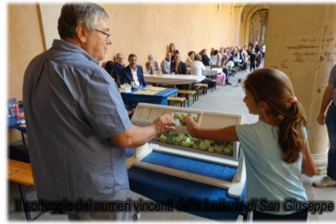
Il sorteggio dei numeri vincenti della lotteria di San Giuseppe