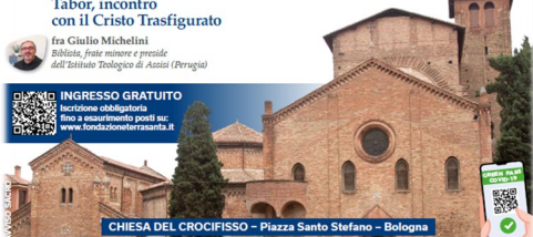
CHIESA DEL CROCFISSO - Piazza Santo Stefano - Bologna