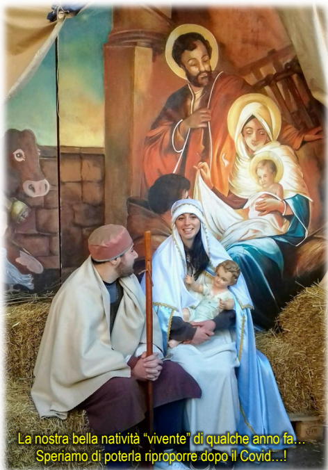
La nostra bella natività "vivente" di qualche anno fa... Speriamo di poterla riproporre dopo il Covid...!